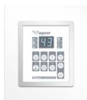
Zewnętrzny panel sterujący z ramką ułatwiającą montaż PHEW3.RB.VAPOR