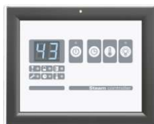
Zewnętrzny, publiczny panel sterujący W.PS-01.P