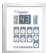
Zewnętrzny panel sterujący PHEW3.VAPOR