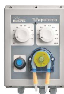
Dozownik aromatu VAPAROMA DA.01-01.PL