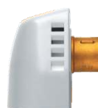
Dysza do wytwornicy GWD.2