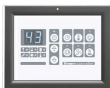
Zewnętrzny panel sterujący W.PS-01